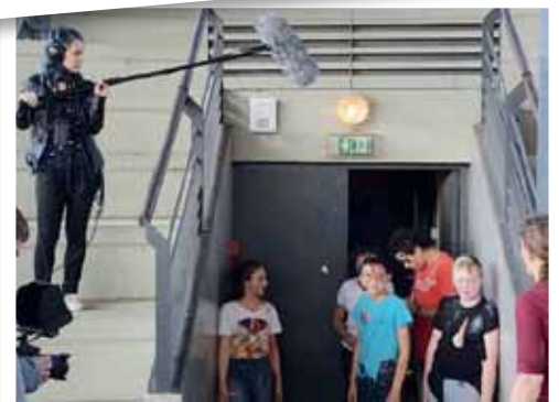
Silence : on tourne !