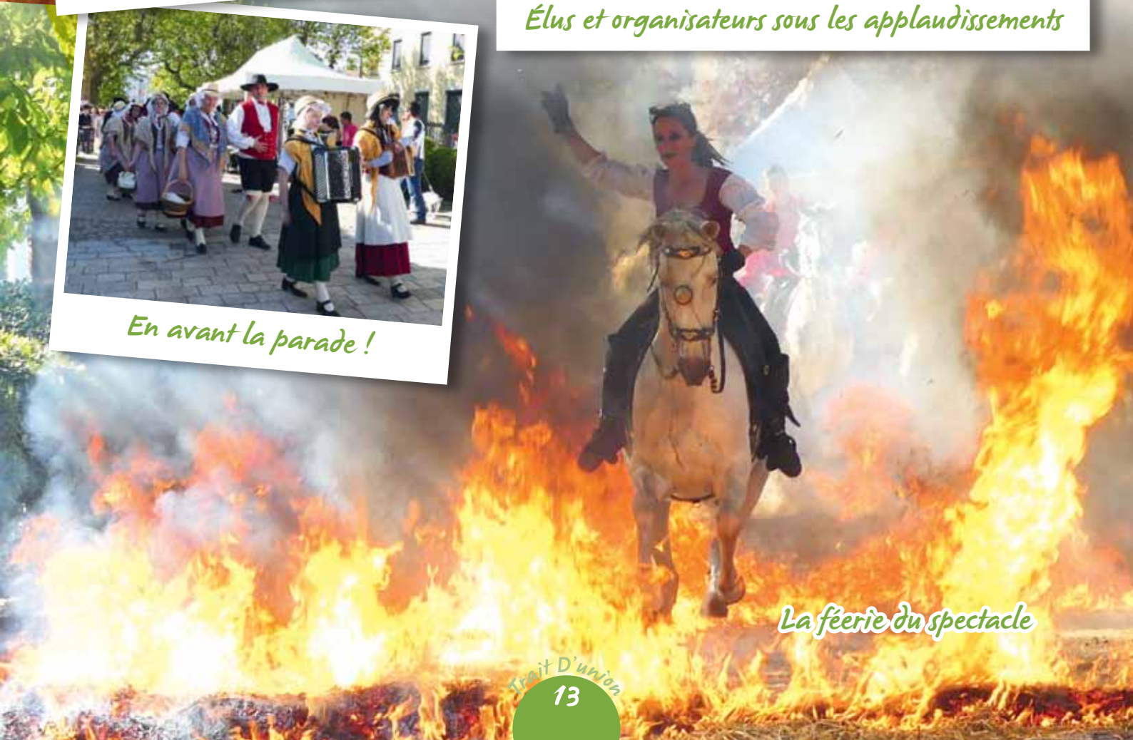
La féerie du spectacle