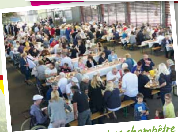
500 convives au repas champêtre