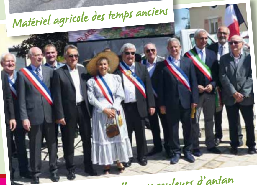
Cérémonie officielle aux couleurs d'antan