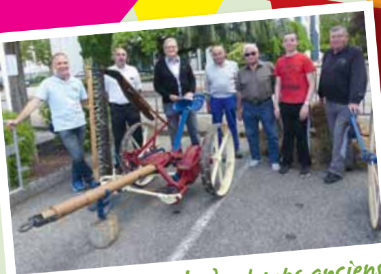
Matériel agricole des temps anciens