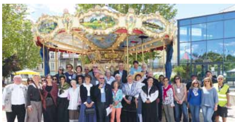
Que la fête commence !

De la joie, de l'émotion, de la fierté, et un petit pincement au cœur à l'évocation de celles et ceux qui nous ont quittés... C'est ce que nous retiendrons de ce week-end de festivités qui a marqué les 150 ans de la commune.