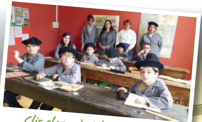
Clic clac : c'est dans la boîte !