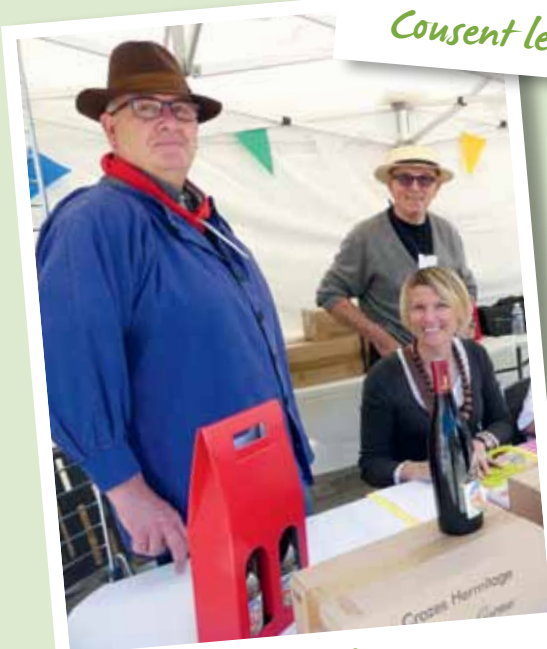
Cuvée spéciale 150 ans