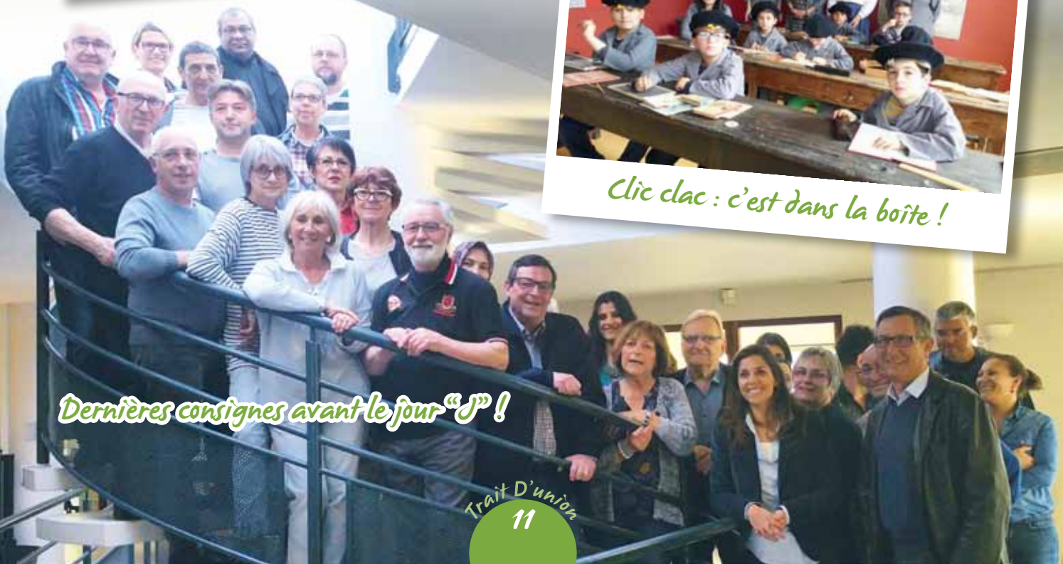
Dernières consignes avant le jour "J" !