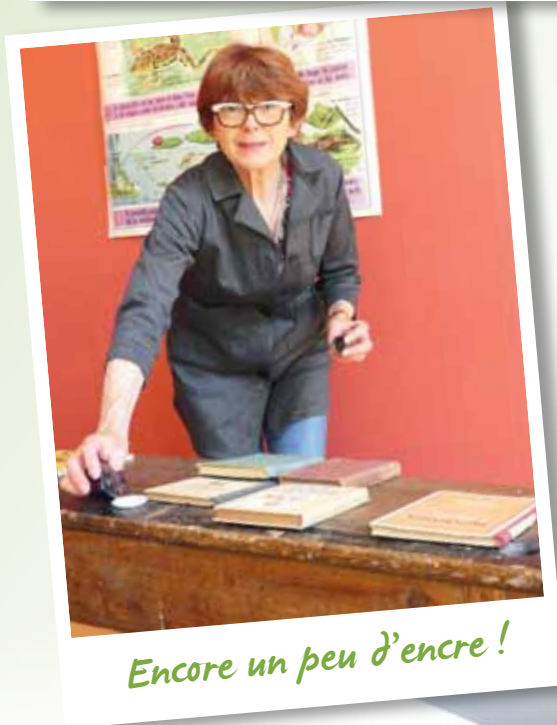
Encore un peu d'encre !