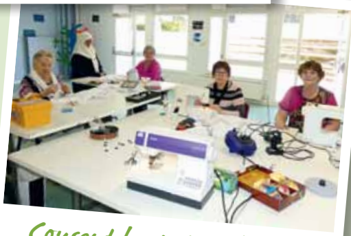
Cousent les petites blouses