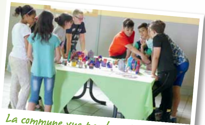
La commune vue par le secteur enfance