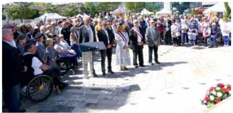
Le temps du recueillement