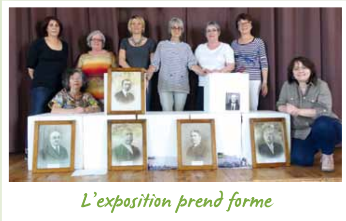
L'exposition prend forme