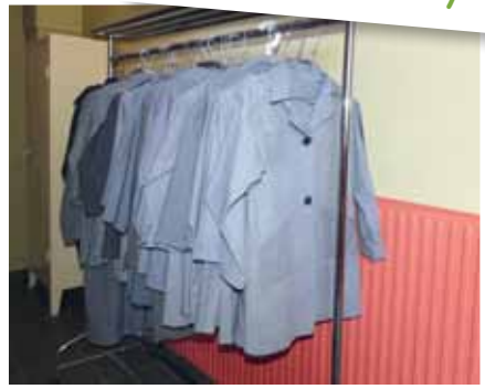
Les blouses sont prêtes