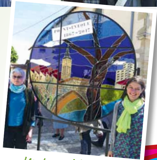
Un travail d'artiste !