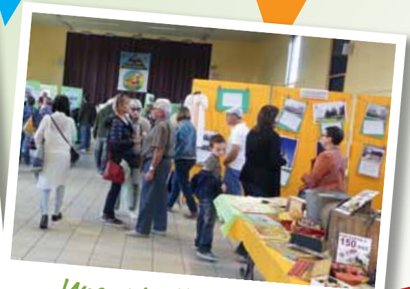
Une exposition à succès