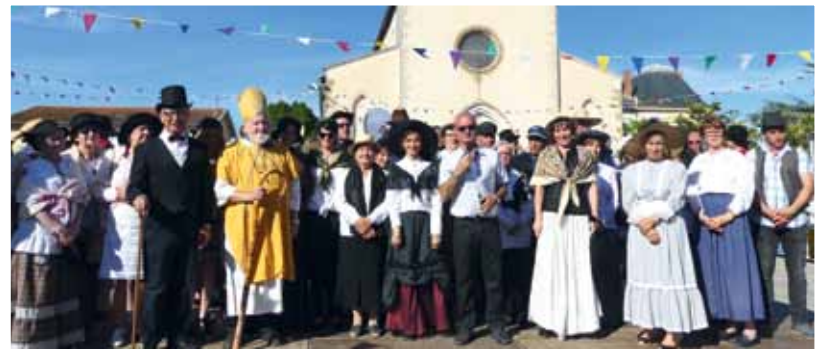
Élus et organisateurs sous les applaudissements