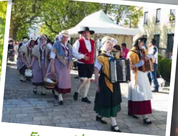
En avant la parade !