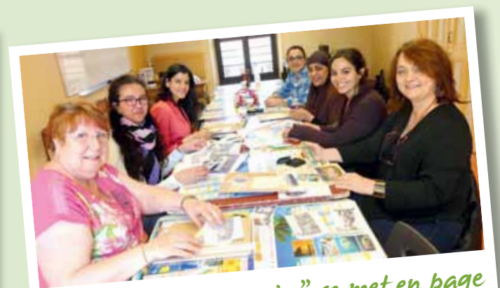
"Mosaïque de souvenirs" se met en page