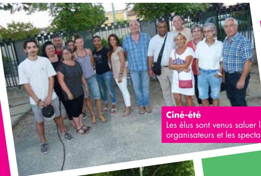
Ciné-été Les élus sont venus saluer les organisateurs et les spectateurs.

Pont-Évêque est une commune dynamique. Retrouvez en images quelques temps forts qui ont ponctué votre été !