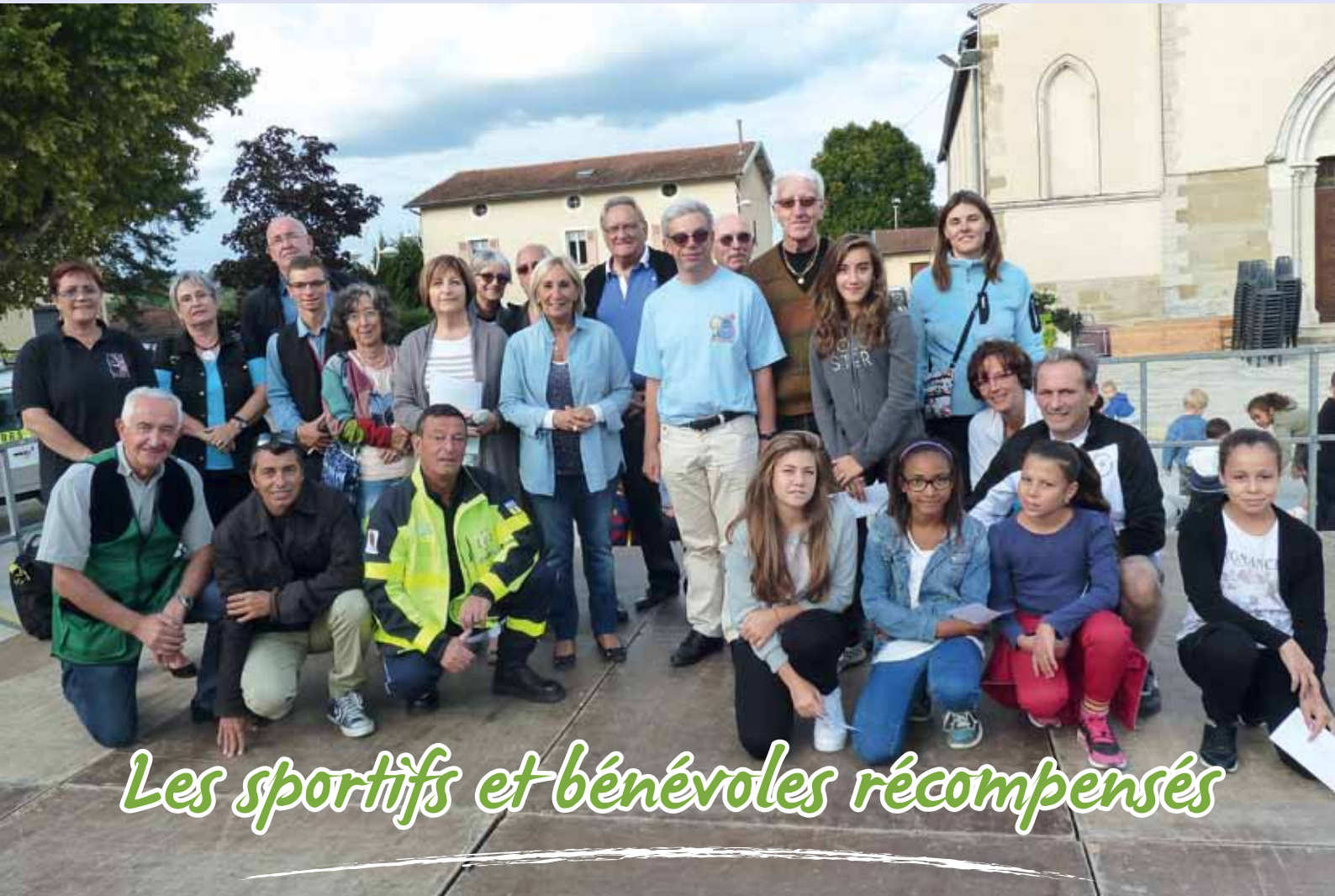
Les sportifs et bénévoles récompensés