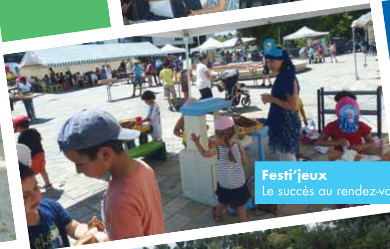
Festi'jeux Le succès au rendez-vous !