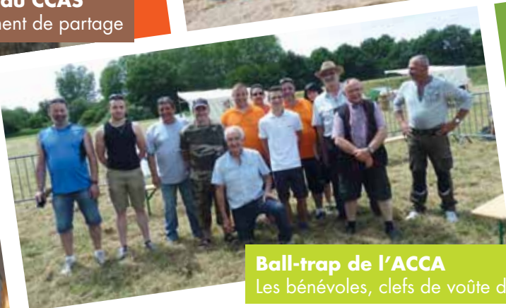
Ball-trap de l'ACCA Les bénévoles, clefs de voûte de l'association