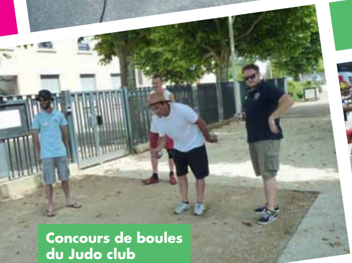
Concours de boules du Judo club On tire ou on pointe ?