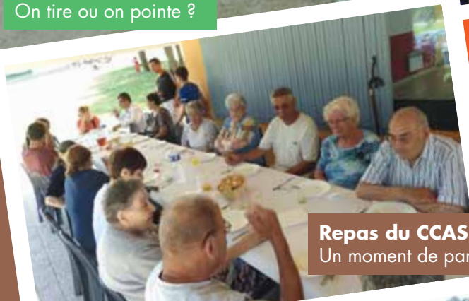
Repas du CCAS Un moment de partage