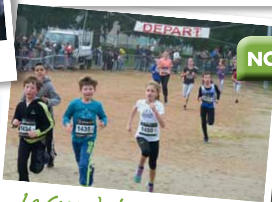
Le Cross de la Municipalité