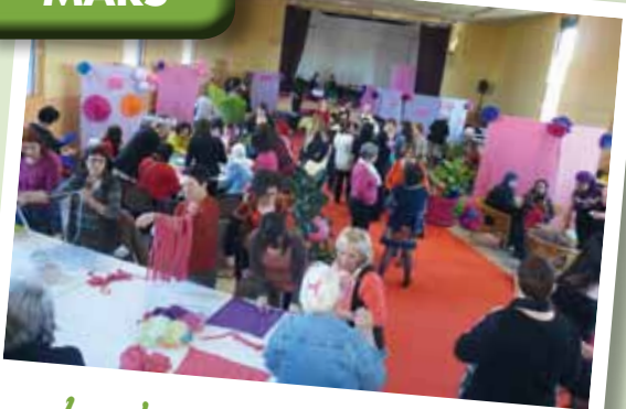
La Journée de la Femme