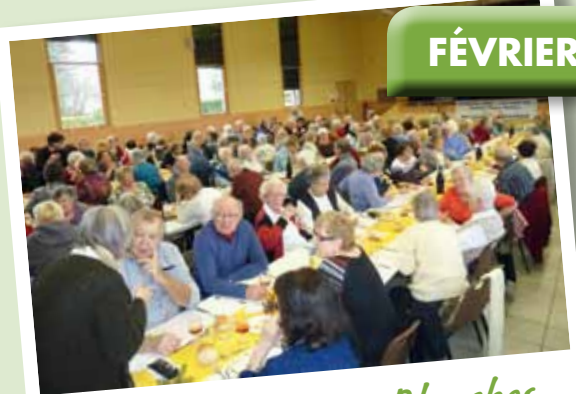
Le repas des Têtes Blanches