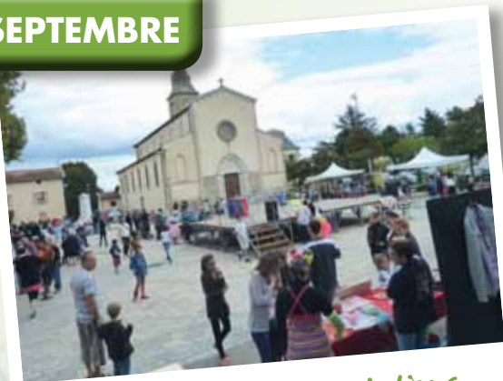
Le Forum des Associations