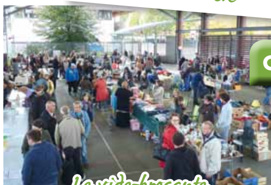
Le vide-brocante du Comité de Jumelage