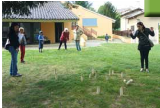
Le Tournoi de Mölkky