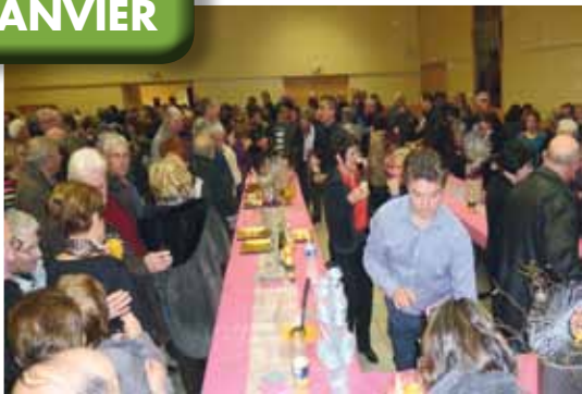
Les vœux du maire